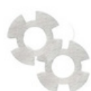
K.20.115.1057.2 Disque blanc nettoyage léger lustrage