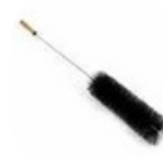
K.1.72.0324.0 Goupillon de nettoyage de bacs