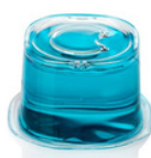
K.120.72.0444.7 E52 Nettoyant quotidien