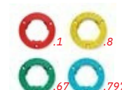
K.2.S.115.1058.1 Fixation brosse code couleur HACCP