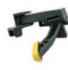
K.1.S.115.0307.357 Kit support de conduite