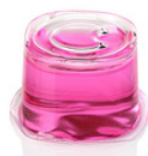
K.120.72.0444.111 E33 Nettoyant sanitaires