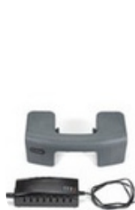
K.1.S.115.0143.0 Batterie : i-power 12 K.1.S.115.0142.0 Chargeur : i-charge