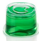
K.120.72.0444.6 E73 Dégraissant