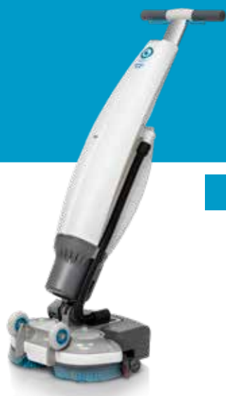
IMOPLT.FCT.1100C imop Lite