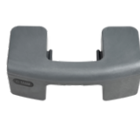
K.1.S.115.0143.0 i-power 12